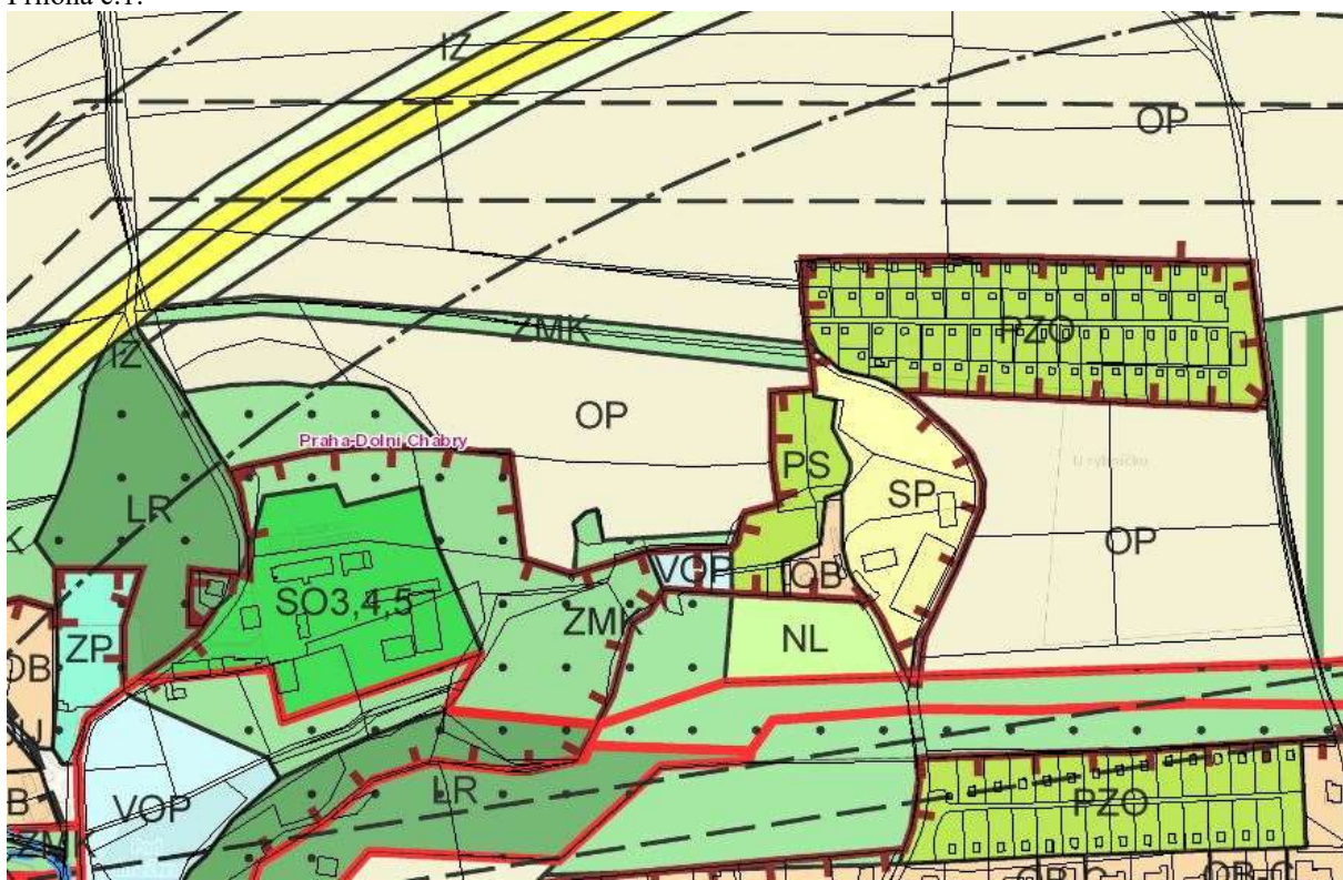
Funkční využití dle platného územního plánu.