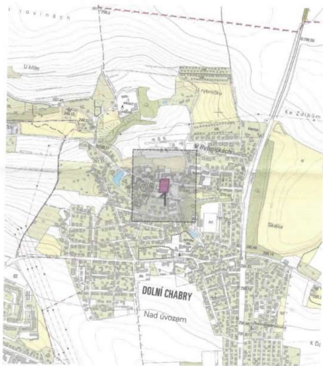
Polygon 1 - Mapa širších vztahů

Evid. č. žádosti: 2023412433 Pořadové číslo polygonu: 1 Katastrální území: Dolní Chabry (území Hlavního města Prahy) 730599 Popis polygonu: