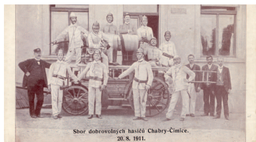
Sbor dobrovolných hasičů Chabry-Cimice, 20. 8. 1911.