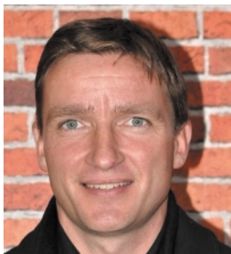
◀ Vladimír Šmicer