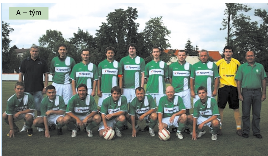
A – tým