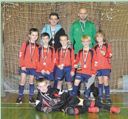
Mladší příprava po zisku stříbra na turnaji na Žižkově.