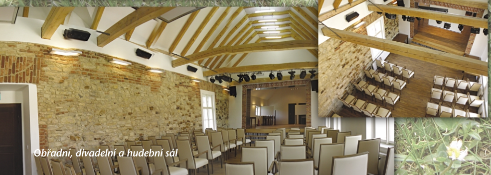
Obřadní, divadelní a hudební sál