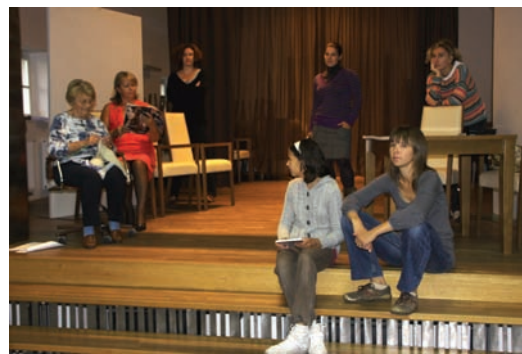
Foto: zkouška hry Osm žen

Jsmo na startovní čáře a vše ukáže i zájem obyvatel Chaber o ochotnické divadlo. Určitě počítáme i s uvedením pohádek pro děti, to je publikum nejdůležitější, na to se těšíme.