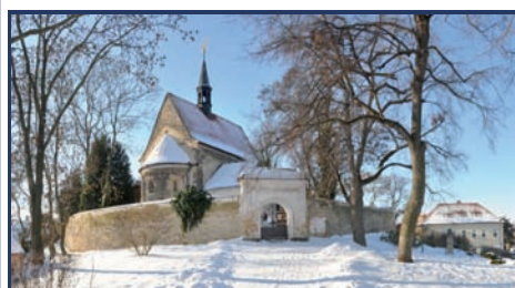
Kostel Stětí sv. Jana Křtitele, Knorův statek Bilenecké náměstí, Praha 8 - Dolní Chabry

Knorův barokní statek vánoční trhy, teplé a voňavé občerstvení dětské dílny - zdobení perníčků, výroba vánočních přáníček