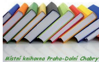
Místní knihovna Praha-Dolní Chabry