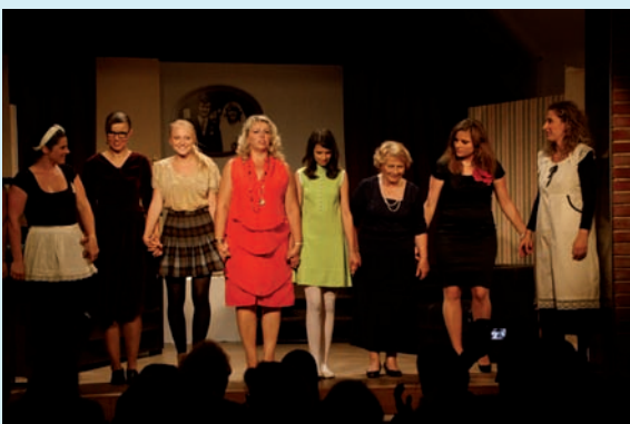
Návrat ochotníků do Chaber – DIVOCH