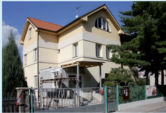
MŠ Chaberaček – přístavba šatny