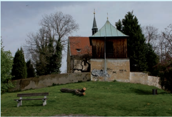
Úpravy zeleně v obci v režii komise životního prostředí