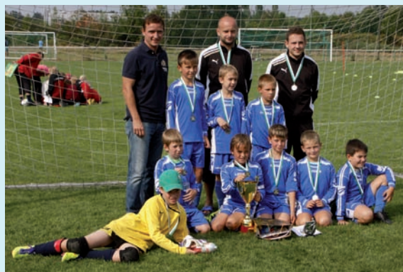
Vláďa Šmicer a jeho mladí následovníci