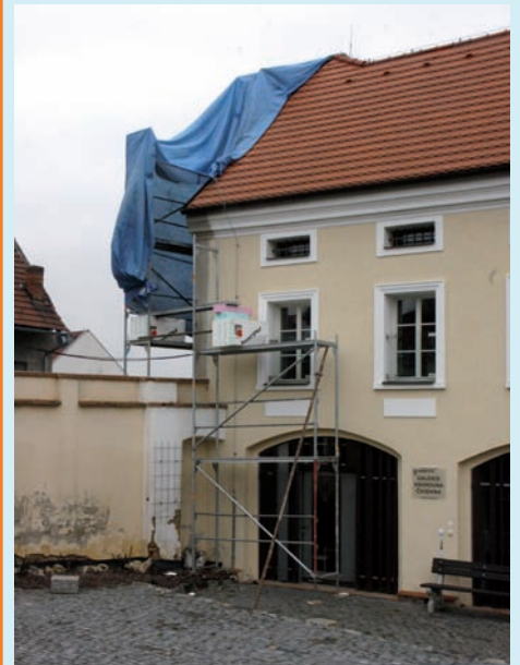
Byly zahájeny nezbytné úpravy objektu CHD