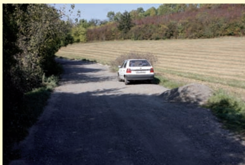
Původní úvozová cesta a dnešní nepovolená úprava