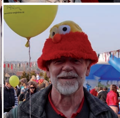
Chaberský masopust 2014 více na str. 3