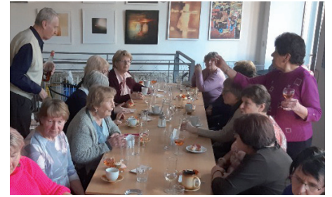
o Velikonocích, ale po celý měsíc duben. Sociální komise

roku, kdy jsme se takto sešli naposledy. My se však dívali do budoucnosti a užívali si přítomnost. Vyladili jsme cíl naší první letošní cesty za krásami naší vlasti, nastínili si program pro letošní rok a probrali všechny možné aktivity, kterým bychom rádi věnovali pozornost. Kam se vypravíme na výlet, dozvíte se v dalším příspěvku tohoto čísla, a co na nás letos čeká? Vše vám přinesou další čísla Zpravodaje. Těšíme se i na všechny z vás, kteří k nám také zavítáte. Hodně radosti a pohody přejeme nejen