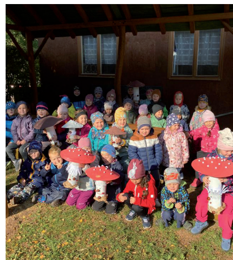
Kolektiv Pohádkové školičky, Bílenecké náměstí