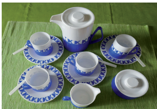
Dosud kompletní plastový kávový servis není, jak je patrné z jeho bruselského designu, mé vnučky Medy, ale můj vlastní. Dostala jsem ho v roce 1970 k šestým narozeninám.